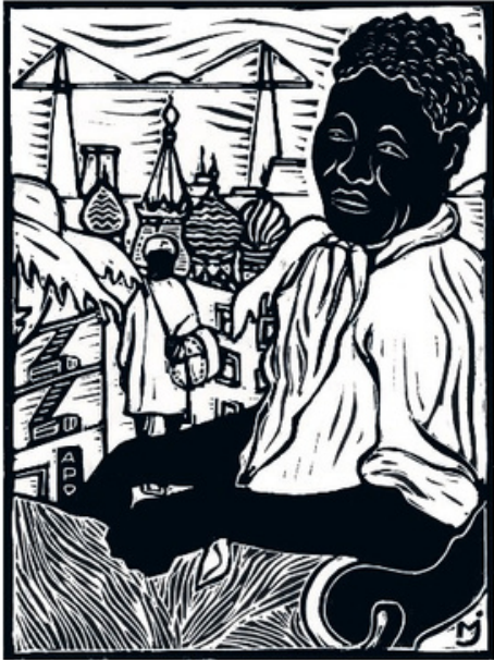
Gravure : Michea Jacobi