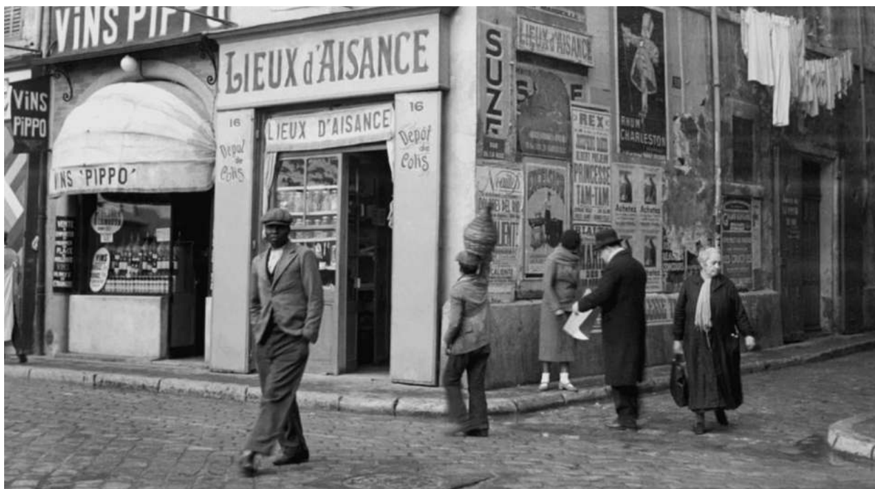
Image d'archive des années 20 à Marseille, extraite du Film McKay, de Harlem à Marseille de Matthieu Verdeil