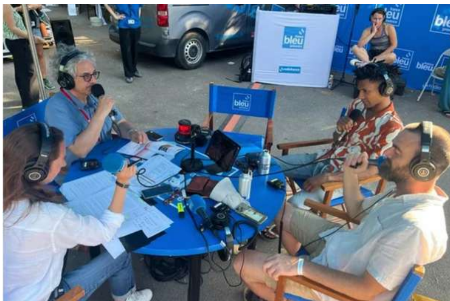
En direct de la soirée d'ouverture du Marseille Jazz 2023