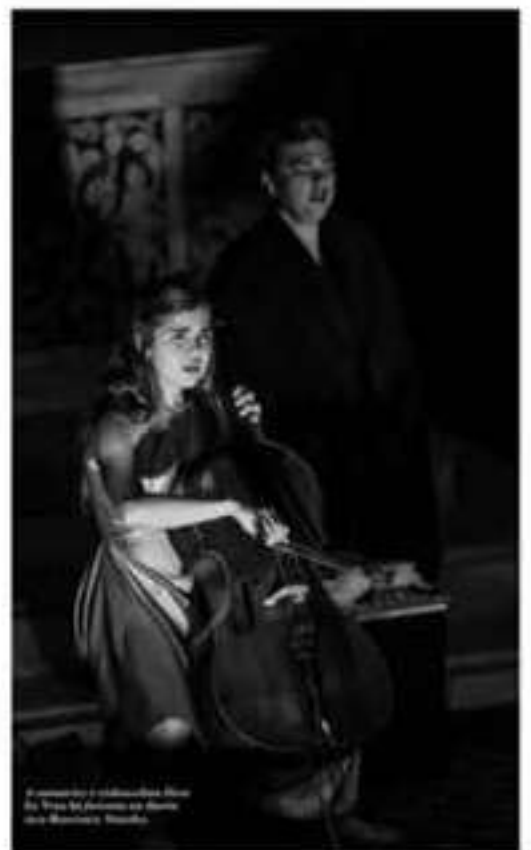
Il gruppo Pulifunie in un momento della performance.