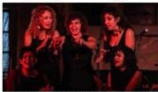
Les dames de la joliette proposent à leur public une diversité musicale centrée sur les rencontres des de la Méditerranée.

« Nous parlons principalement d'hommes de nature et de rôle de la femme à travers l'histoire, le patrimoine et la culture. Les dames de la joliette ont proposé à leur public un voyage musical centré sur des polyphonies méditerranéennes. Malgré les mesures sanitaires, l'association a choisi de maintenir la 32 e édition des rencontres polyphoniques. Hier matin, « Les dames de la joliette » ont proposé à leur public un voyage musical centré sur des polyphonies méditerranéennes.