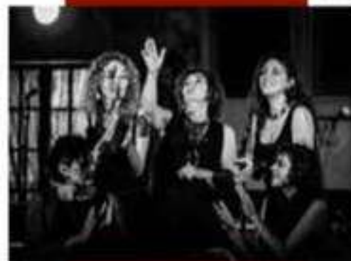
Il gruppo Pulifunie in un momento della performance.