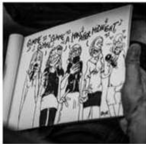
Il gruppo Pulifunie in un momento della performance.