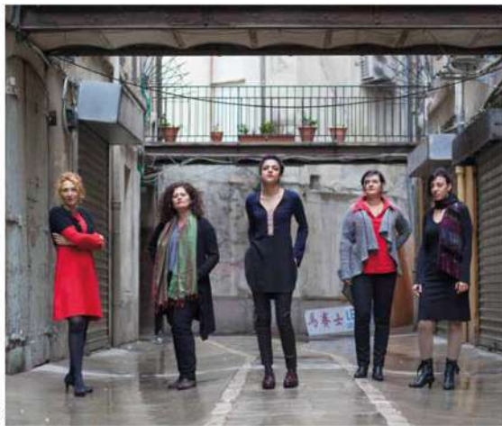
Les Dames de la Joliette ? Cinq chanteuses et femmes marseillaises héritières de l'esprit de résistance.