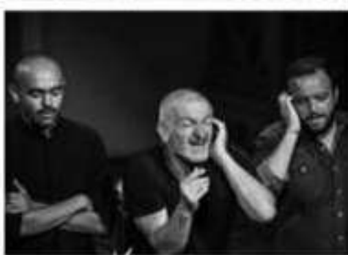
Il gruppo Pulifunie in un momento della performance.