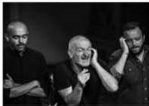
Il gruppo in un momento del concerto. In alto: un altro momento del concerto. In basso: il gruppo in un momento del concerto.