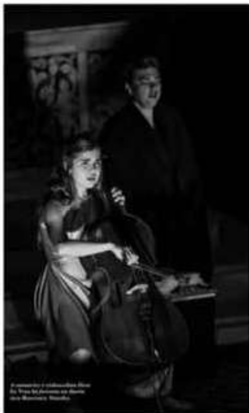
Il concerto a cadavere. Sotto la luce del riflettore una donna siede. In basso: il gruppo.