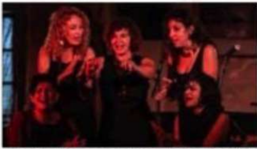
Les dames de la joliette proposent à leur public une diversité musicale centrée sur les rencontres des de la Méditerranée.

« Nous parlons principalement d'artistes de nature et de ville de la femme à travers l'histoire, le patrimoine et la culture. Les dames de la joliette ont proposé à leur public un voyage musical centré sur des polyphonies méditerranéennes.