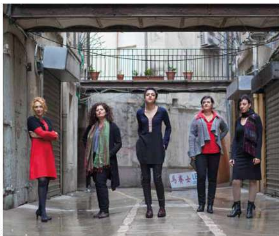
Les Dames de la Joliette ? Cinq chanteuses et femmes marseillaises héritières de l'esprit de résistance.