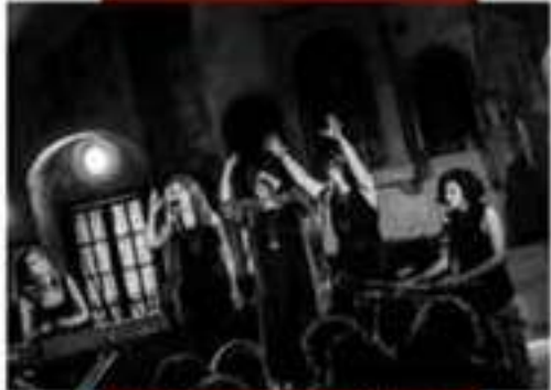
Il gruppo in un momento del concerto. In alto: un altro momento del concerto. In basso: il gruppo in un momento del concerto.